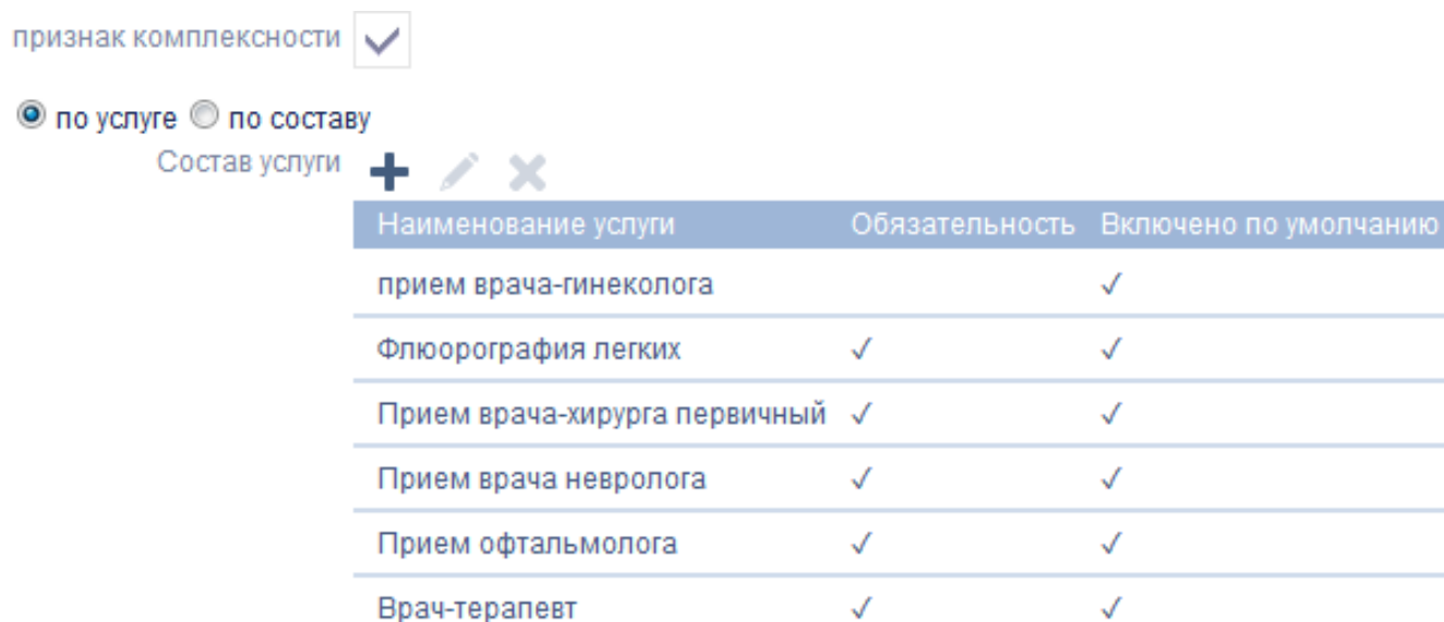
Рис.2. Перечень простых услуг комплекса

Пример: создаем комплексную услугу (Рис. 2):